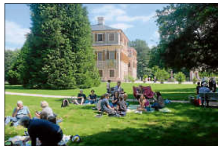
...und gemeinsames Picknick

Es ist vorgesehen, dass die Jugendfreizeit im nächsten Jahr in Fère-Champenoise stattfindet. Die Einladungen an die Jugendlichen für den Austausch 2025 werden voraussichtlich im Dezember verteilt werden.