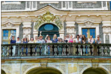
Ausflug zu Schloss Favorite...